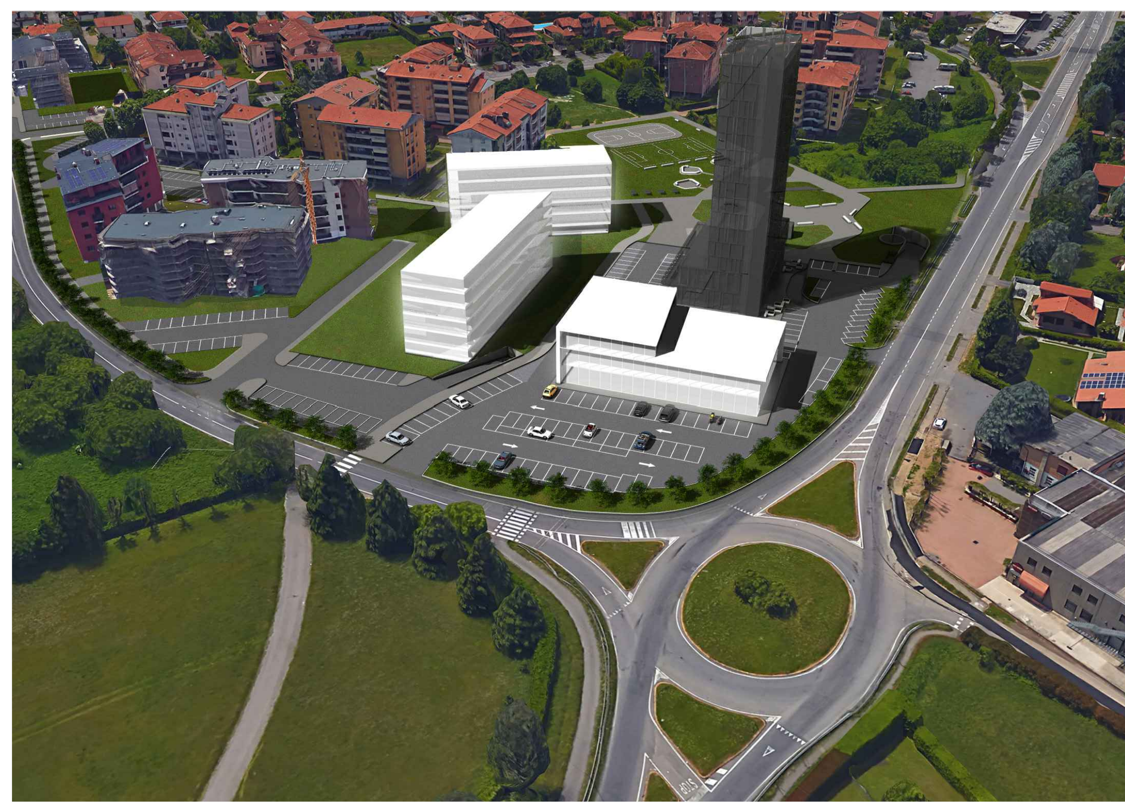
vista prospettica da nord-est