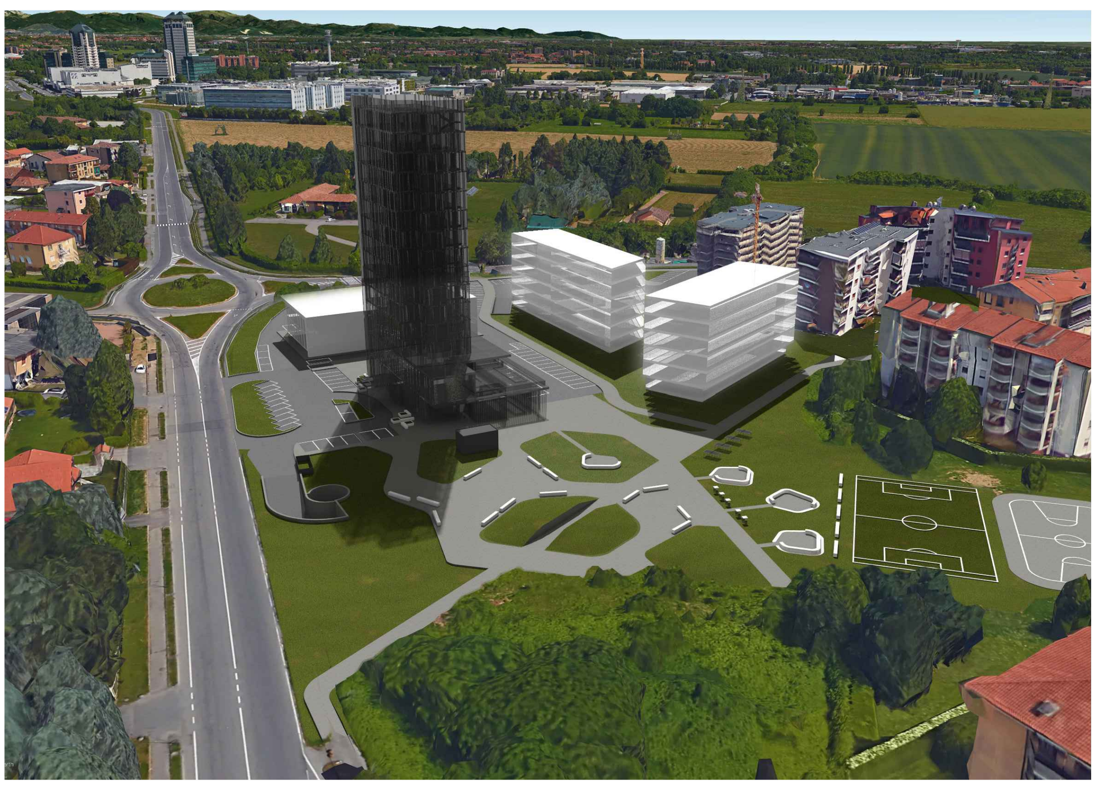
vista prospettica da nord-ovest